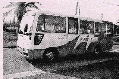
ヤシのマークの中型バス

西武が運行するシャトルバスは、より多くの住民の利用に供するため、4月1日より乗車整理券を200円から100円に値下げしました。乗車券は車内でも販売しています。