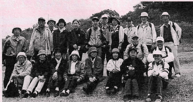
こうして住民の輪が広がる(御宿台歩こう会)

御宿台には種々の同好サークルがあります。スポーツ、手芸、ダンス、園芸など多様な活動を通じて住民相互の親睦に役立っています。陽気のよい春の訪れを機会に、あなたもいずれかのサークルに参加しては？(添付資料2参照)