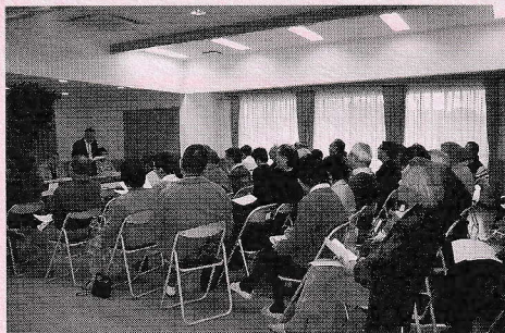
活発な討議が進行中

15年度の活動方針と予算が提示され、承認されました。詳細は添付資料1をご参照ください。