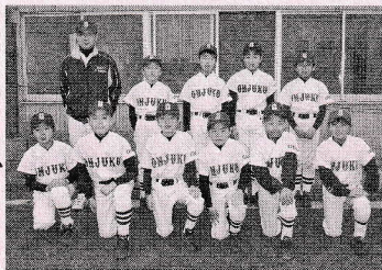
新入団員随時募集中!

現在、高齢化率県下No.1の御宿町で小学生の団体スポーツを扱うチームを維持していくのは容易なことではありません。少子化による選手不足の問題だけでなく、少年スポーツの振興や青少年育成に対する行政の理解や支援が他市町村と比較して圧倒的に乏しい現実があるためです。しかし、将来を夢見る野球少年のために、今後も彼らの活躍の場を提供していくことが重要だと考えています。