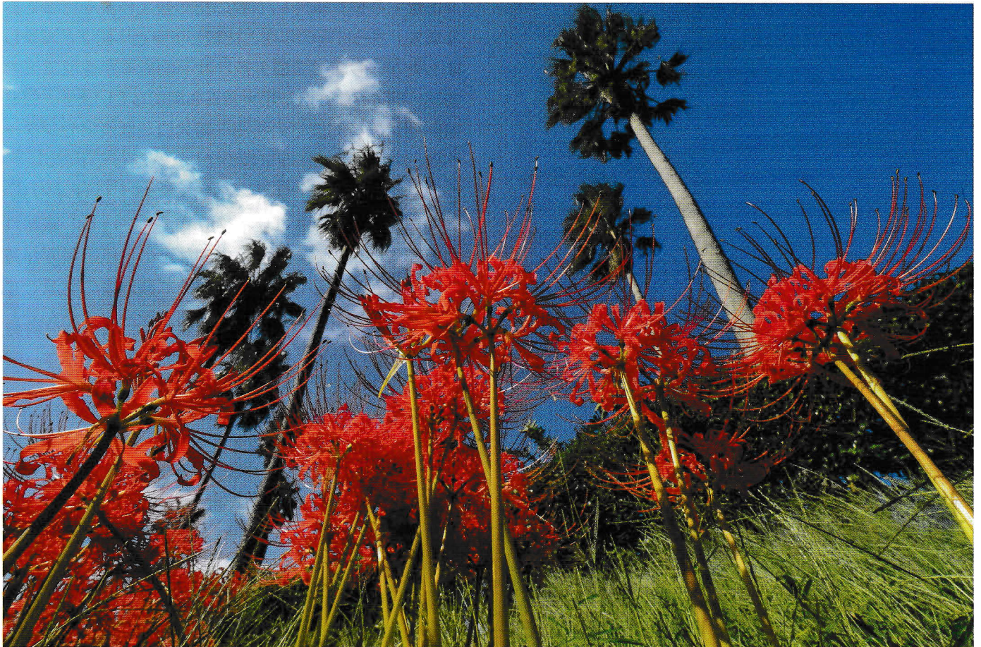
『彼岸花と椰子の木』 福田 延隆 (337-07)