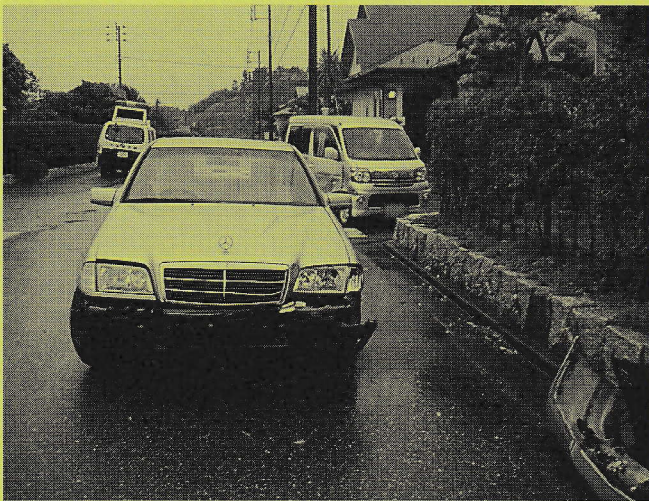
4月28日 事故で始まった今年のGW

事故処理中の警察官に話を聞いたところ、御宿台での交通事故はほとんどがこのパターン（横道から幹線道路に入る際の不注意）で発生しているとのこと。交差点での一時停止と安全確認を心がけましょう。