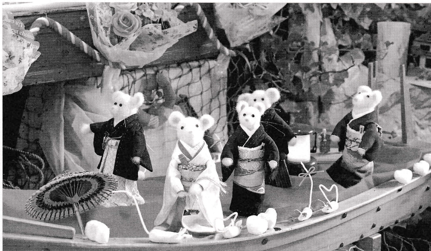
「ねずみの嫁入り」 (311-11)