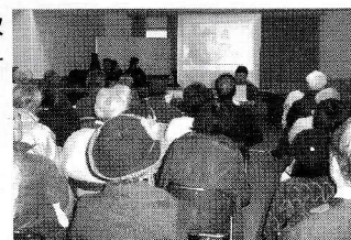
DVDを使って理解を深めました