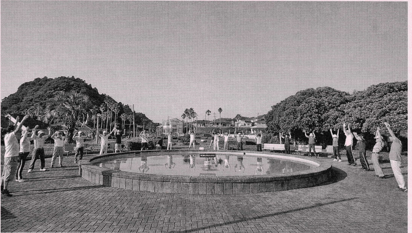
健康は朝の体操から！ (331-9)